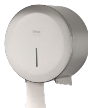
VEIRO JUMBO STEEL

Широко применяется в местах общественной гигиены с высокой и средней проходимостью в Офисных и Административных зданиях, заведениях сегмента HoReCa, Медицинских учреждениях, на объектах Транспорта, Спортивных объектах.