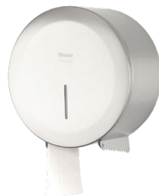
VEIRO JUMBO STEEL

Широко применяется в местах общественной гигиены с высокой и средней проходимостью в Офисных и Административных зданиях, заведениях сегмента HoReCa, Медицинских учреждениях, на объектах Транспорта, Спортивных объектах.