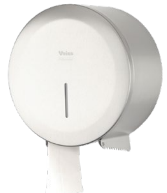
VEIRO JUMBO STEEL

Широко применяется в местах общественной гигиены с высокой и средней проходимостью в Офисных и Административных зданиях, заведениях сегмента HoReCa, Медицинских учреждениях, на объектах Транспорта, Спортивных объектах.