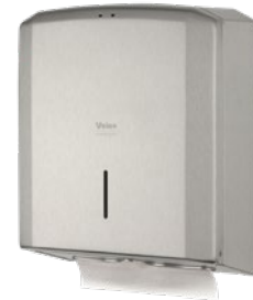
VEIRO PRIMA STEEL

Бумажные полотенца Z-сложения широко применяются в общественных туалетных комнатах Офисных и Административных зданий, Торгово-развлекательных центров, заведениях сегмента HoReCa, на объектах Транспорта, а также в смотровых кабинетах Медицинских и косметологических учреждений. Диспенсеры Veiro Prima, Veiro Prima mini и Veiro Prima Steel гарантируют экономичность использования листовых бумажных полотенец, благодаря полистовой системе подачи. Средний расход 1-2 листа. Большая вместимость (500-600 листов) позволяет сокращать периодичность обслуживания. Диспенсерные системы предотвращают контакт с внешней средой и обеспечивают максимальную гигиеничность применения бумажной продукции и полное отсутствие перекрёстного загрязнения.