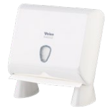
VEIRO PRIMA MINI