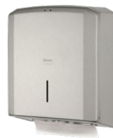
VEIRO PRIMA STEEL

Бумажные полотенца Z-сложения широко применяются в общественных туалетных комнатах Офисных и Административных зданий, Торгово-развлекательных центров, заведениях сегмента HoReCa, на объектах Транспорта, а также в смотровых кабинетах Медицинских и косметологических учреждений. Диспенсеры Veiro Prima, Veiro Prima mini и Veiro Prima Steel гарантируют экономичность использования листовых бумажных полотенец, благодаря полистовой системе подачи. Средний расход 1-2 листа. Большая вместимость (500-600 листов) позволяет сокращать периодичность обслуживания. Диспенсерные системы предотвращают контакт с внешней средой и обеспечивают максимальную гигиеничность применения бумажной продукции и полное отсутствие перекрёстного загрязнения.