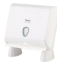
VEIRO PRIMA MINI